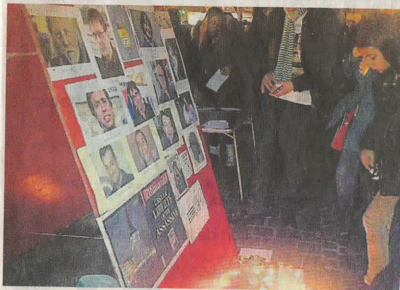
Des personnes ont allumé des lumignons abrités sous une tente.